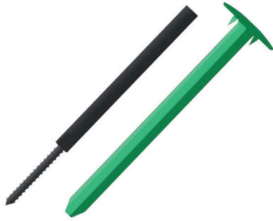
VILPE Croco A -kiinnike + säädettävä ruuvi

Säädettävä Croco-ruuvi 95 on yhteensopiva Croco A- ja B-kiinnikkeisiin (malli 100 tai suurempi). Säädettävä Croco-ruuvi 150 sopii Croco A- ja B-kiinnikkeisiin (malli 150 ja suurempi).